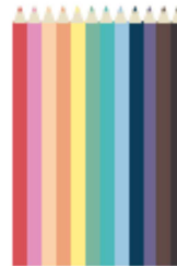
12 crayons de couleurs