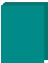
Un grand classeur rigide (4 anneaux)