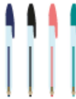
4 Stylos à billes (noir, vert, bleu, rouge)