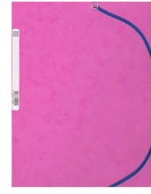
Chemise cartonnée 3 rabats