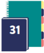
Agenda (Pas de cahier de textes)