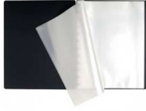
Porte-vues (80 vues minimum)